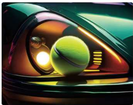
Image créée en IA générative