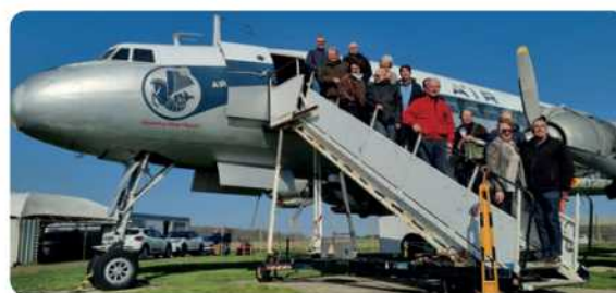
le 6 mars 2025, Loire Atlantique

Une vingtaine d'adhérents s'est réunie pour la visite très attendue du Super Constellation. Un moment qui a débuté autour d'un petit déjeuner à 9h30 avant d'entamer le tour de cet avion légendaire. Pendant qu'une partie visitait l'aéronef, l'autre explorait au musée les pièces de la 2 de guerre mondiale retrouvées près du site de l'aéroport de Nantes. Nous avons été très bien reçus et la visite s'est admirablement déroulée. Les participants cette fois-ci étaient différents, j'ai eu l'occasion de rencontrer ainsi de nouveaux membres et certains n'étaient pas venus depuis 5 ans. Nous avons agréablement poursuivi ce moment au restaurant situé dans la zone aéroportuaire.