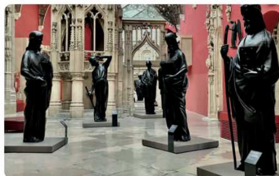
Les statues des Saints qui entourent la flèche de Notre-Dame

L'originalité depuis l'été 2024, c'est d'avoir choisi des visites littéraires, telles les 2 " Sur les pas de Verlaine et Rimbaud", ou "Les Passages couverts au travers des écrivains qu'ils ont inspirés" (3 visites), mais aussi l'accès réservé à la Philharmonie de La Villette (2 visites) ou la découverte d'un musée vivant "La Cité de l'architecture et du patrimoine" (2 visites) saisissant l'occasion unique de voir les 16 statues restaurées des Saints qui entourent la flèche de Notre Dame de Paris, avant qu'elles ne soient remontées.