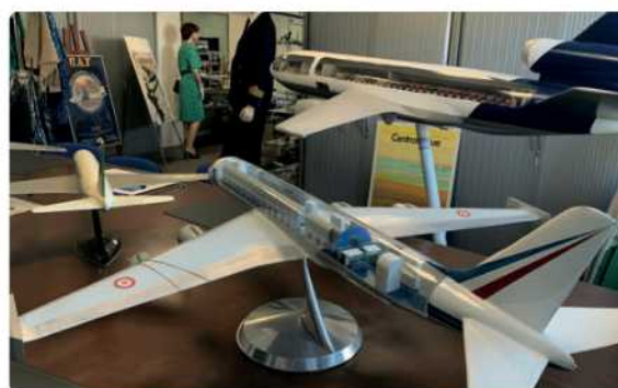
Le Sarigue et l'emblématique DC 10

Nous voilà dans un musée très attractif où l'on retrouve avec émotion les affiches d'un réseau étendu sur l'Afrique, l'Asie-Pacifique et l'AMN ; des uniformes de couturiers célèbres et avant-gardistes tels Cardin, Dior et Courrèges, des pièces de collection rares telle la maquette unique du "SARIGUE" DC8 transformé par l'UTA pour l'Armée de l'Air, celle du Comète de l'UAT, ou encore celle du Super Guppy, sans oublier la maquette commerciale du DC10, fleuron de l'image de marque de l'UTA.