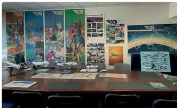
UTA, tout un réseau