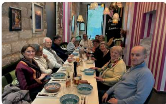
le 12 mars 2025, Hérault, journée départementale

C'est dans le cadre des réunions locales organisées par chaque délégué départemental que plusieurs adhérents de l'Hérault se sont réunis dans un restaurant fort sympathique de Montpellier pour échanger souvenirs et informations. Ce fut un moment de convivialité et de partages amicaux, bien utiles et nécessaires dans un monde en plein changement et bouleversement. Ce n'est que le début de nos réunions dans notre région.