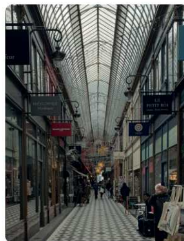
Passage couvert de Paris