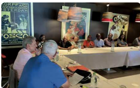
le 11 mars 2025, journée régionale

C'est dans le joli cadre du Créole Beach hôtel que s'est tenue la première JR 2025, reportée de novembre à cause des événements locaux ; une journée particulière où le souvenir d'Eliane, évoqué bien sûr, était très présent dans l'esprit de chacun.