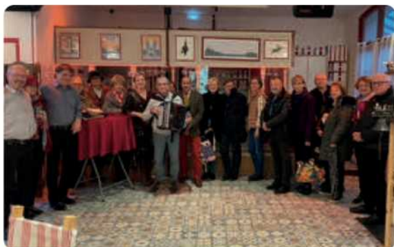
29 octobre 2024, journée départementale, Oise

Dans les régions, d'autres idées ont animé la saison hivernale. Pour exemple, la région Nord a inauguré un déjeuner dansant à la Bodegare de Betz.